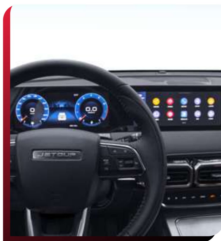
SISTEMA DE INFOENTRETENIMIENTO Y MIRROR LINK