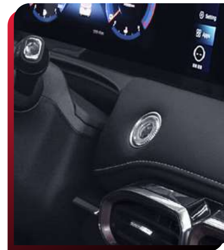
SMART KEY (BOTÓN DE ENCENDIDO)