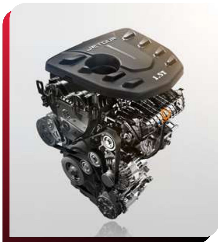
MOTOR 1.5 / 1.6 TURBO

Pon a prueba la resistencia de esta gran SUV